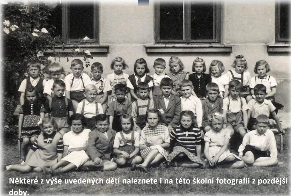
Některé z výše uvedených dětí naleznete i na této školní fotografii z pozdější doby.